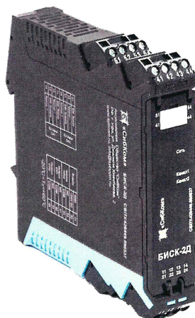
Рисунок 1 - Внешний вид средства измерений

Внешний вид преобразователя и места нанесения знака поверки представлены на рисунках 1 и 2.